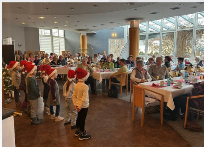
Die Vorschulkinder der Käfergruppe aus dem Kinderland in Suhl stimmten mit Weihnachtsliedern auf die Adventszeit ein.

An festlich geschmückten Tafeln bei Kaffee und leckeren süßen und deftigen Häppchen wurden Ideen für zukünftige Vorhaben "geboren".