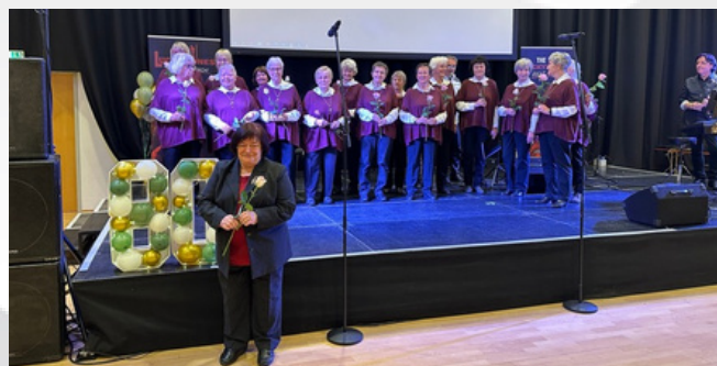
Der Auenchor der Volkssolidarität sorgte für einen musikalischen Start in den Nachmittag.

Anschließend sorgte der Auenchor der Volkssolidarität für einen musikalischen Start in den Nachmittag.