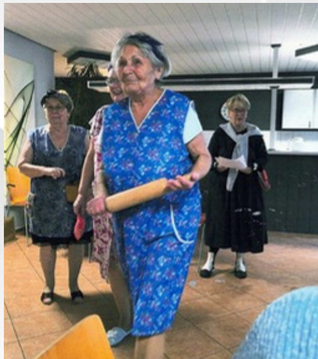
Eine Modenschau der Suhler Klamottenkiste sorgte für jede Menge Spaß und guter Laune