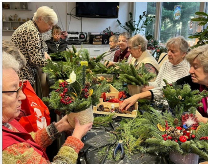
Tannengrün, Reisig, Zapfen, Sterne, Nüsse, Kugeln und viel Deko-Material warteten auf die kreativen Damen und Herren der OG 30/31.