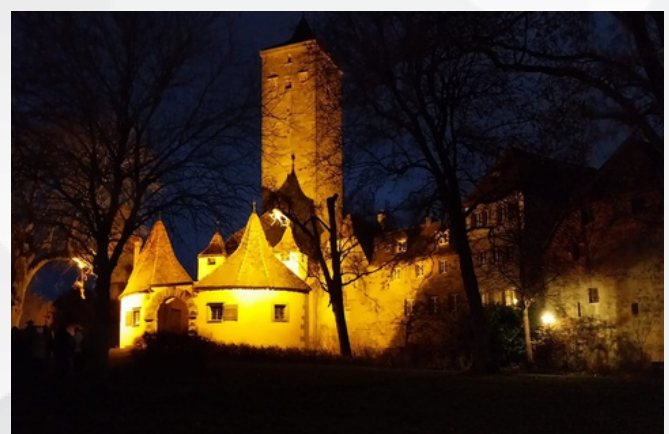
Die mittelalterliche Burganlage in Rothenburg bei Nacht.