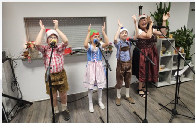
Die Rennsteigspatzen zu Gast in der Begegnungsstätte der Aue 80

Am 28.11.25 war es in der Begegnungsstätte der Aue 80 wieder besonders stimmungsvoll: Die Rennsteigspatzen waren zu Gast und erfreuten die Anwesenden mit Weihnachts- und Winterliedern sowie Gedichten. Mit ihrem Programm stimmten sie die Gäste auf die bevorstehende Advents- und Weihnachtszeit ein. Eingeladen waren Mitglieder der OG 31 sowie Bewohnerinnen und Bewohner aus dem angrenzenden Wohngebiet. Bei Kaffee und Kuchen genossen insgesamt 46 Gäste den gemütlichen Nachmittag und die festliche Atmosphäre. Ein herzliches Dankeschön an das Team der Aue 80 für ihre Mühe und Hingabe, die solche besonderen Momente für unsere Bewohnerinnen und Bewohner möglich machen!