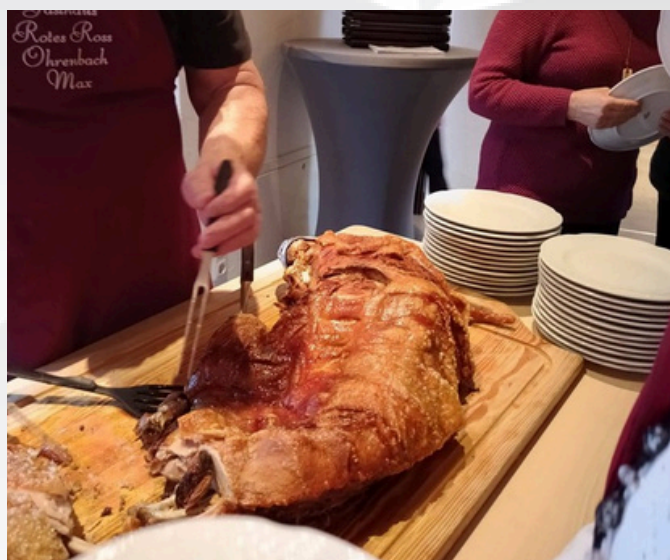
Zum Essen gab es zartes Spanferkel mit einer Honig-Kruste.