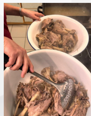
Das Schlachtfest kam bei den Leuten gut an.

Die herzhafte Veranstaltung brachte die BewohnerInnen und Gäste in gemütlicher Atmosphäre zusammen und bot traditionelle Thüringer Küche im besten Sinne.