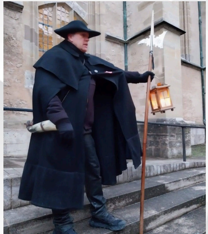
Der Nachtwächter der Stadt Rothenburg o.d. Tauber

Jeder hatte die Möglichkeit, den Nachmittag nach eigenen Vorstellungen zu gestalten. Um 16:30 Uhr trafen wir uns mit dem Nachtwächter der Stadt. Mit ihm unternahmen wir eine äußerst interessante Zeitreise durch den Ort. Anschließend ging es zurück zum Bus, und um 21:00 Uhr endete unsere Rückfahrt nach Suhl.