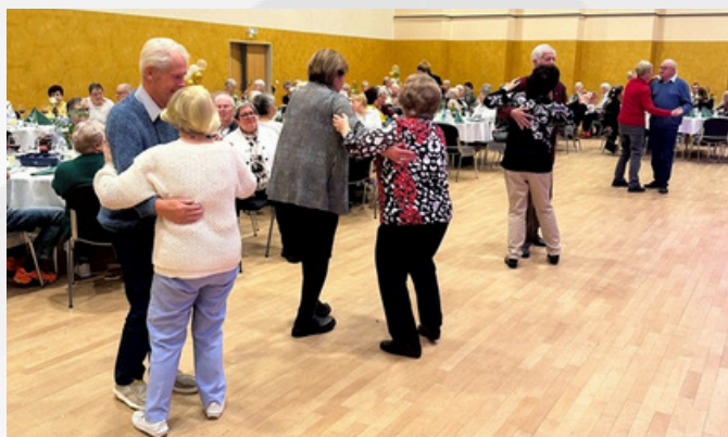
Die Gäste hatten jede Menge Spaß und ließen das Tanzbein schwingen.

Den feierlichen Auftakt bildeten die Eröffnungsreden von Thomas Thömmes, Vorstandsvorsitzender des Volkssolidarität Regionalverband Südthüringen e.V., Karola Stange, Aufsichtsratsvorsitzende des Volkssolidarität Landesverband Thüringen e.V. und Jan Turczynski, Bürgermeister der Stadt Suhl. Sie würdigten die beeindruckende Geschichte und die große gesellschaftliche Bedeutung der Volkssolidarität – damals wie heute.