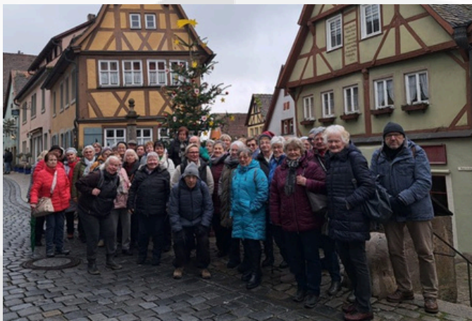
Die Reisegruppe in der Altstadt von Rothenburg o.d. Tauber

Danach fuhr der freundlicher Busfahrer uns nach Rothenburg, und gemeinsam machten wir uns auf den Weg in die Stadt. Unterwegs hielten wir an, um ein schönes Gruppenfoto zu machen.